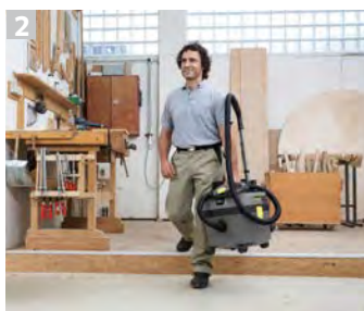
2 Mobilità e performance. Combina design compatto e performance per uso professionale.