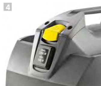
4 Presa elettroutensile. Con funzione Start/Stop automatica (solo Te).